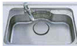
ステンレスシンク