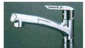
ハンドシャワー水栓