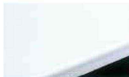
人造大理石ワークトップ