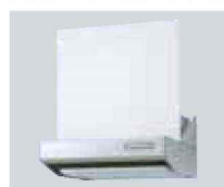
レンジフード VMAタイプ